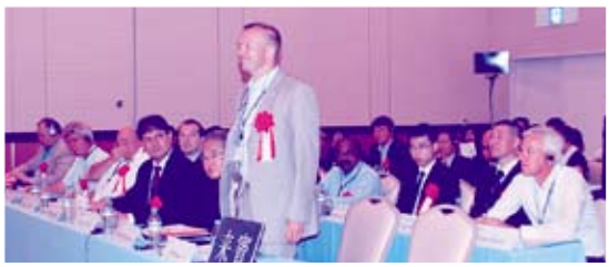
14ヵ国・地域20組織から27名のIMF加盟組織代表が参加

つづいて第2号議案「規約・規程の一部改訂の件」、第3号議案「2010年度一般会計剰余金処分の件」、第4号議案「2011年度会計予算の件」につ