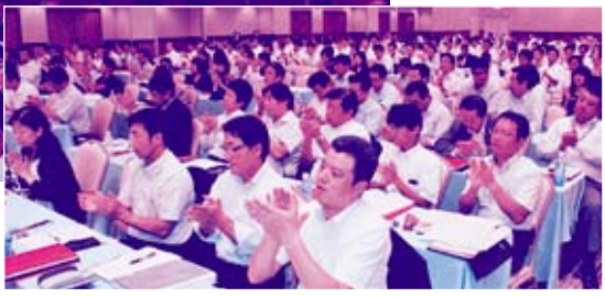
満場一致の拍手で新運動方針を決定

冒頭、西原議長が挨拶に立ち、国際連帯活動や国内活動について所信を述べた。(→要旨2面参照)