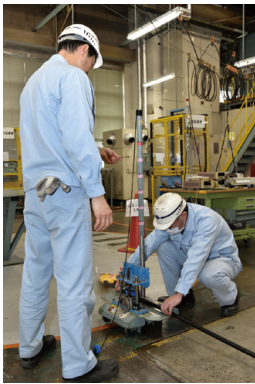
光ファイバケーブルの「衝撃検査」

テープスロット型ケーブルには1本0.25mmという細さの光ファイバを2〜12本並べてプラスチックの樹脂で固めたテープ心線というものを使用する。光ファイバは一本一本色付けがされており、後からどの線かを識別できるようになっている。それらを収納するスロットの溝は直