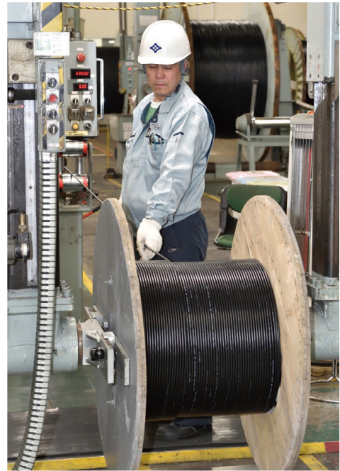
光ファイバケーブルをドラムに巻き取る作業の様子

回の表紙の写真は、「衝撃検査」という光ファイバケーブルの耐久性を検査している様子である。ケーブルの上から重りを落として衝撃を加え、基準通りの耐久性があるかどうかを検査する。製品の仕様によって重りの重さと、衝撃を与える間隔を細かく変えているという。普段は外側の黒いシースしか見えていないが、その中には様々な技術や工夫が込められている。また、ケーブルの巻き取りや検査が人の手によって、とても丹念に行われているのを目の当たりにして、ものづくりにかける深い思いを垣間見た気がした。私たちが普段何気なく利用している通信機能は、こういった一人ひとりの日々の努力で支えられているのだと感じながら、工場内に流れる川の両岸に植えられた、もうすぐ満開になろうとする桜をながめつつ、工場を後にした。