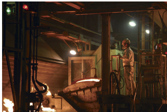
鍛造工程で砂型に1500℃に溶解した鉄を注ぎ込む注湯作業