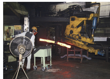
カウンターブローハンマーによるハンマー鍛造の工程

2棟の鍛造工場と、3棟の鍛造工場は、工場内の広い道路で仕切られている。鍛造、鍛造ともに1400度近くの高温に熱する炉を持っており、熱さと作業音と金属が熱せられた独特の臭いの中で、一人ひとりの働く仲間が、溶接をしたり、砂型の湿りを加えたり、プレス作業をしたり、それぞれ自分の持ち場で懸命に働いている姿が輝いていた。ベテランの班長が作業員の肩をだきながら耳元できめ細かな指示をしている姿が印象深かった。(美)