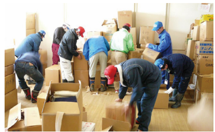
各地からの支援物資の仕分け作業