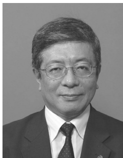
西原浩一郎 (自動車総連会長)