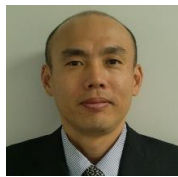
井上 正弘 いのうえ・まさひろ 政策企画局長兼 財政会計総括 基幹労連出身