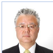
野中 孝泰* のなか・たかひろ 電機連合書記長