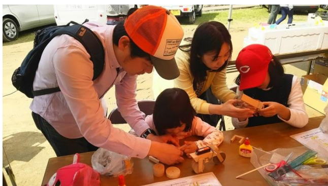
▲説明手順書を見ながら出来るよ