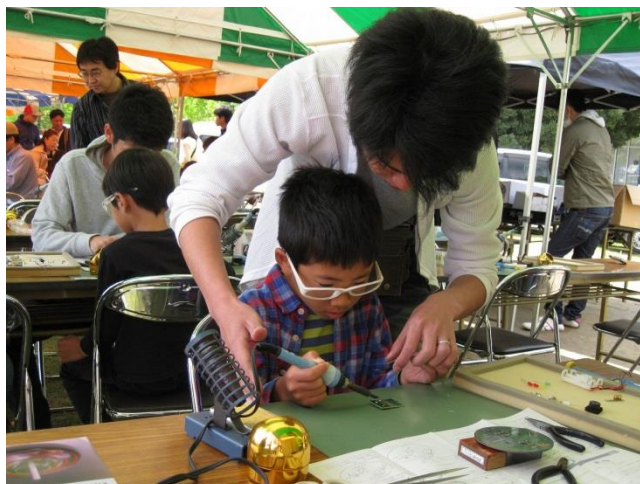
▲スタッフ（三菱電機労組）による丁寧な指導