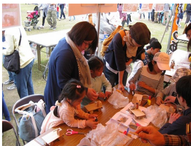
▲真剣な眼差しで、みんな必死です