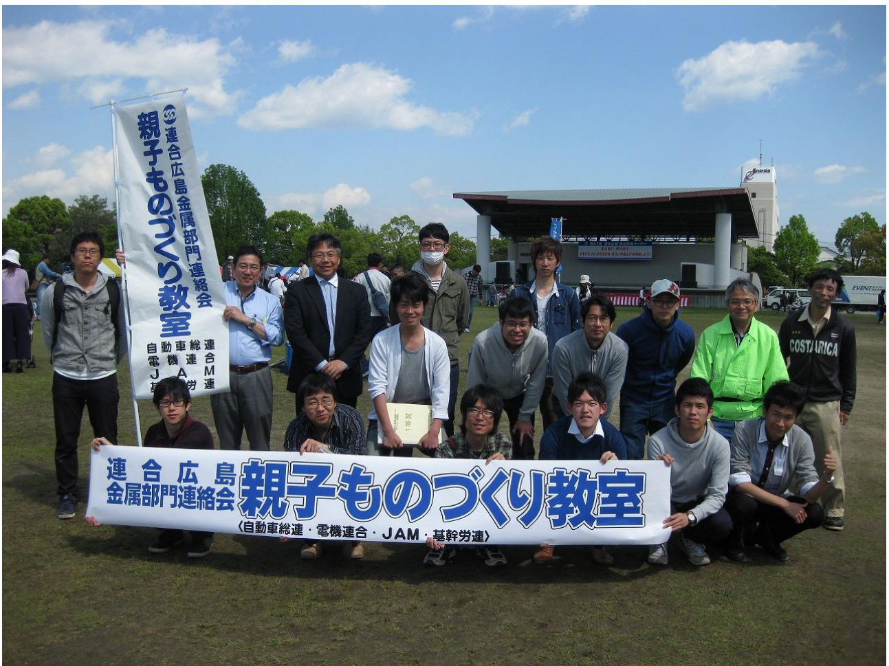
▲組合員スタッフの皆さん、大変お疲れ様でした