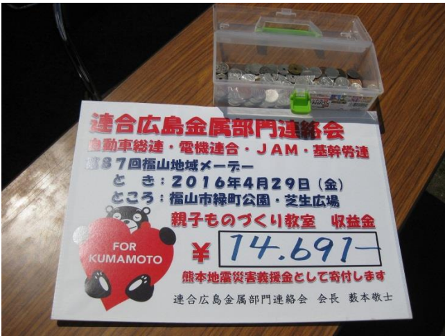
▲ご協力ありがとうございました