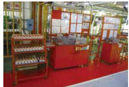
オレンジ色の品質チェックゾーン

を突き詰めていった結果が、いすゞの場合、機械やラインに人を合わせるのではなく、人間の動きに合わせて、人に優しいやり方で改善しており、「労働の人間化」に結びついている。人間に優しい日本のものづくりモデルをここに見て感動すると共に誇りを感じた。