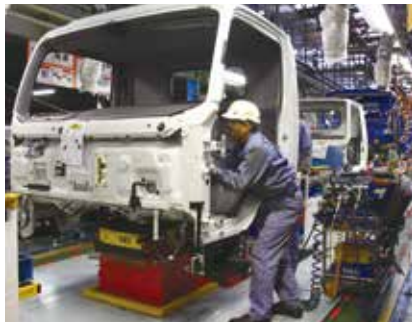
トラックフロント部分の機装工程

現在、同工場で製造しているのは、大型トラック『ギガ』、中型トラック『フォワード』、そして主力製品である小型トラック『エルフ』だ。トラックだから、部品点数は乗用車と比