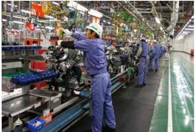
エンジンの組み立てライン

表紙イラストは、機装組み立て工程で、トラックの運転席部分のシートや内装取り付けの作業しているところ。組み立て作業も、人間の姿勢に合わせて、機械がトラックなどを傾かせて、作業がやりやすいような位置に向こうからやってくる。品質向上と生産性向上