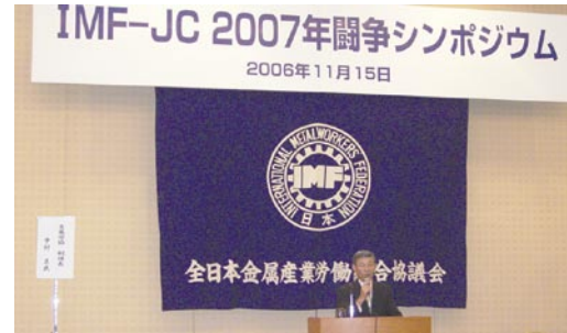
2007年闘争シンポジウム

戦術委員会の指示に基づき、戦略・戦術の具体的内容の検討、相互の連絡調整を目的として運営する。