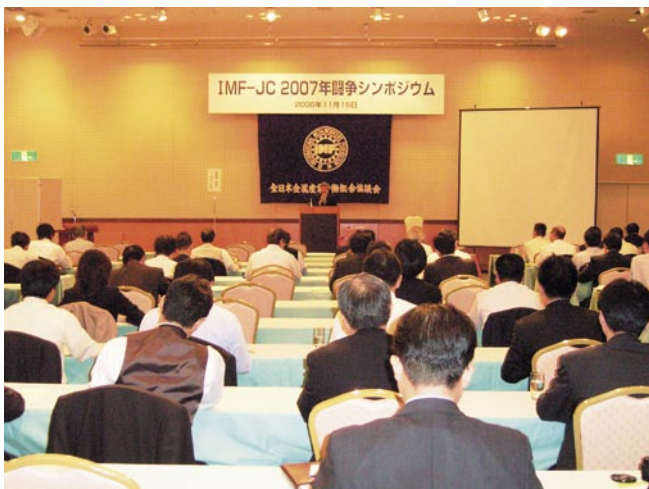
金属労協は2007年闘争シンポジウム(11月15日、東京)を開き、2007年闘争を取り巻く情勢、課題について講演等を通して問題意識を高めた

金属労協は、連合・金属部門の活動を実質的に担う組織として、2007年闘争の成功に向けて役割を果たしていくとともに、連合・他部門との連携を強化しつつ闘争を推進する。また、化学エネルギー鉱山労協 (ICEM - JAF) とも連携していく。