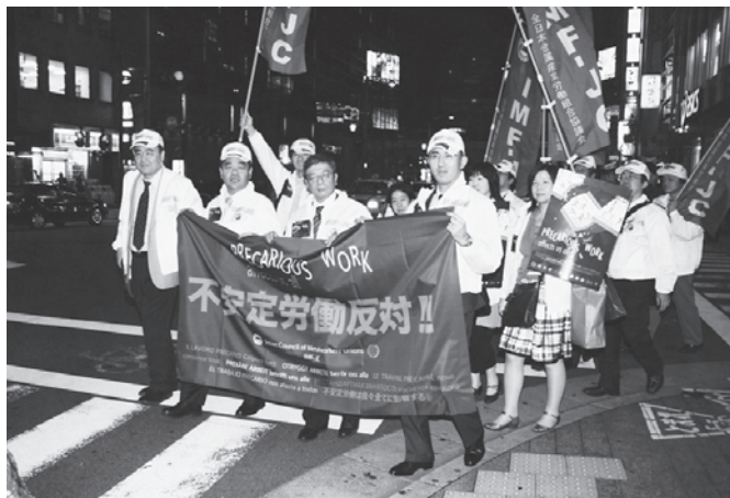
不安定労働反対」の横幕を手にアピール・ウォークするMF-JC役職員 (ディーセントワーク中央集会、2008年10月9日、東京)