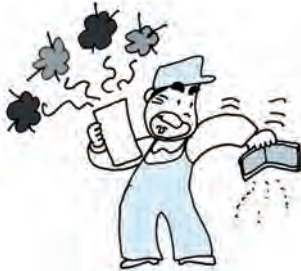
景気低迷と物価上昇が家計にも大きな影響を与えている