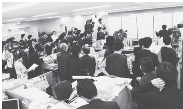
2008年闘争JC集中回答日ーマス 「2008年3月12日」 コニでびったがえす金属労協事務所

*2009年度はすべての産業別最低賃金について金額改正を行うとともに、積極的に新設に取り組むこととします。