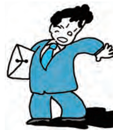
景気後退懸念の広がりとともに、雇用環境は益々厳しさを増していく