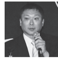
事例報告する荒川本田技研労組副委員長