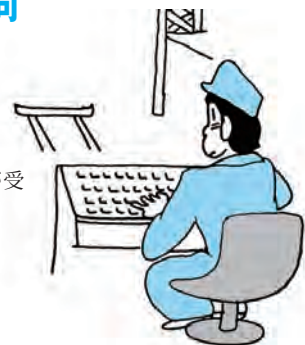
輸出比率の高い企業が受ける打撃は深刻