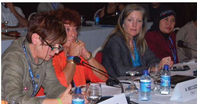
不安定労働に関するIMF女性ワークショップ。

作業部会メンバーは、IMF加盟組織間の定期的な交流と、姉妹組織との連携強化の重要性を繰り返し強調した。作業部会は、FTAの将来分析において部門別に焦点を当てるよう勧告した。貿易ルールに労働権