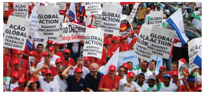
2,000人の金属労働者がブラジル・バイア州サルバドルの通りを行進し、不安定労働に抗議した。