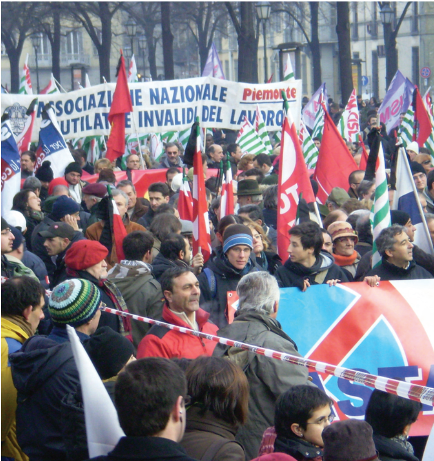
12月10日にトリノでストを行うイタリアの労働者：鉄鋼工場の悲劇で6名が死亡した。

働者退職基金から補償金を支給され、その後、転職制度の適用を受けることになっていた。