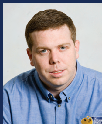
新人 ポール・ハウズ氏

2007年11月、ビル・ショートウンの連邦議会議員選出に伴い、ポール・ハウズが後任のオーストラリア労組(AWU)全国書記に選出された。