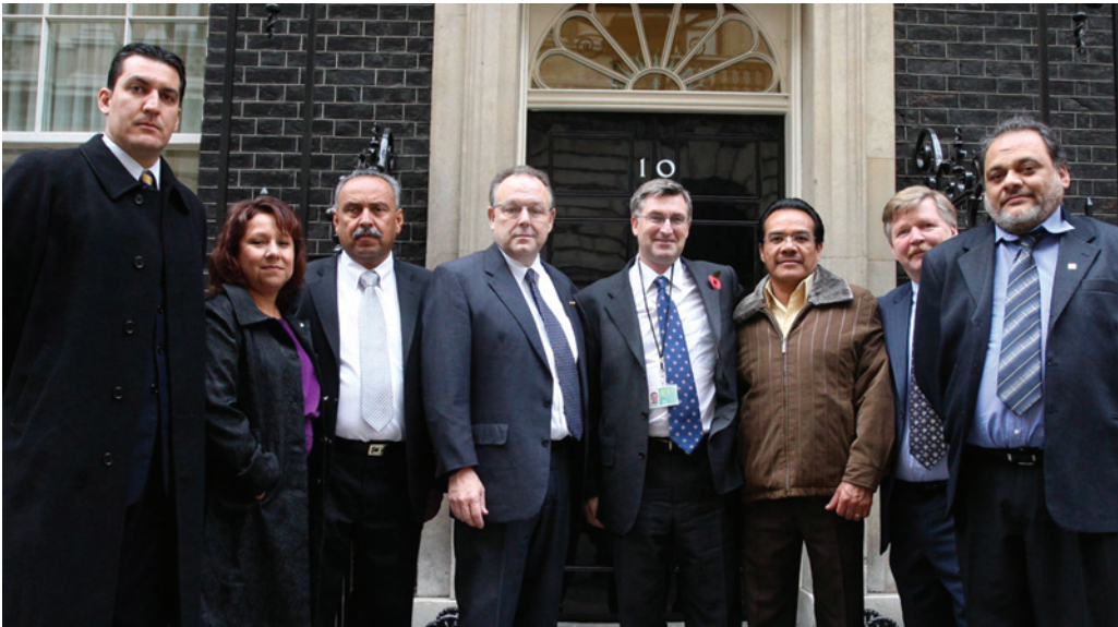
IMF代表団はイギリスで国会議員と会談し、メキシコ鉱山・金属労組の弾圧について議論した。