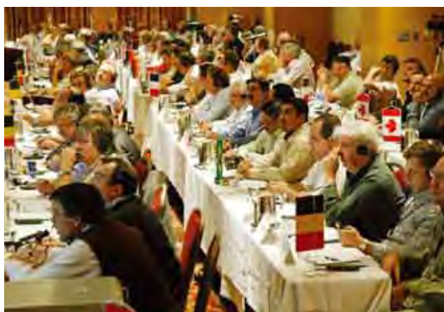
2007年9月にモンテリオールで開かれたアルセロール・ミッタル会合にIMF加盟組織が集まり、同社との世界的な安全衛生協約について討議し、草案を作成した。

新協約により、100種類を超える職種に就く約18万人の臨時労働者の最低賃金率が引き上げられる。工業環境で働いている労働者は、賃金は上がらないが、医療保険、有給医療休暇、安全衛生改善、訓練機会を獲得する。パートタイム労働者は給付が増え、契約期間が延長される。